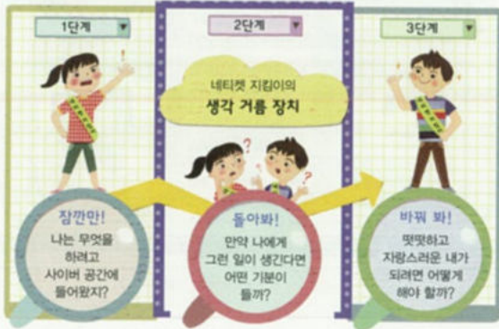
4. 밝고 건전한 사이버 생활