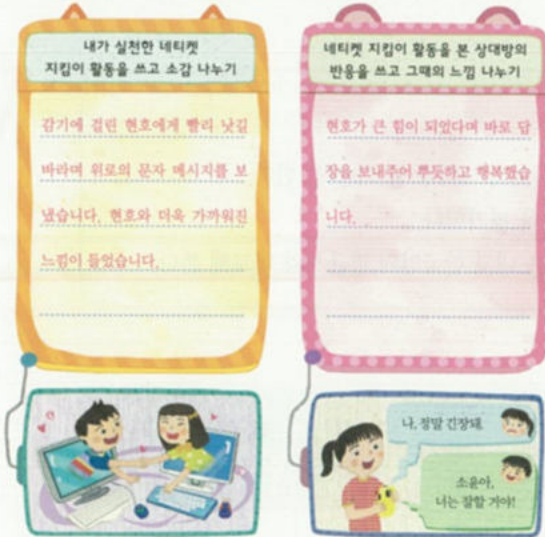
4. 밝고 건전한 사이버 생활

★ 네티켓 지킴이 활동을 실천해 보고 그때의 생각이나 느낌을 이야기해 봅시다.